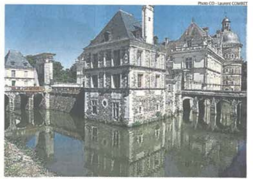
Seul château rural à obtenir trois étoiles, Serrant va sûrement faire des jaloux dans le département. Mais la subjectivité fait partie des choix du guide touristique.