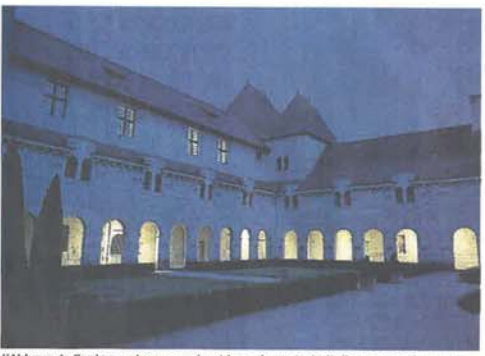
L'Abbaye de Fontevraud conserve haut la main ses trois étoiles, non seulement pour l'abbatiale, mais aussi pour l'ensemble de son œuvre. Incontestable.

moyens et ne peuvent pas se targuer d'une histoire aussi royale, mais peuvent sourire quand même. Ainsi Doué-la-Fontaine est-elle récompensée de ses efforts pour avoir créé le Mystère de faluns dans ses caves troglodytes des Perrières : le site gagne sa première étoile, tout comme le village troglodyte voisin de Rochemenier qui attire des dizaines de milliers de visiteurs en racontant la vie sous terre des paysans d'autrefois. A la hausse également, le Parc oriental de Maulévrier a beaucoup séduit l'équipe du guide. Il doit sa deuxième étoile à son audace et au dynamisme de son équipe. Autrefois oublié et en friches, le Parc débordait aujourd'hui d'idées diurnes et nocturnes. Comme quoi le patrimoine n'est pas la seule carte à abattre pour se distinguer dans le Guide Vert. Le travail des hommes et des femmes, souvent bénévoles, sait aussi y porter ses fruits.