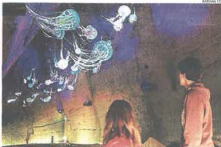
Le Mystère des Faluns est désormais classé par les sites Intéressants.

Pas moins d'une cinquantaine de sites se retrouvent étoilés en Anjou, et dans toutes les territoires du département.