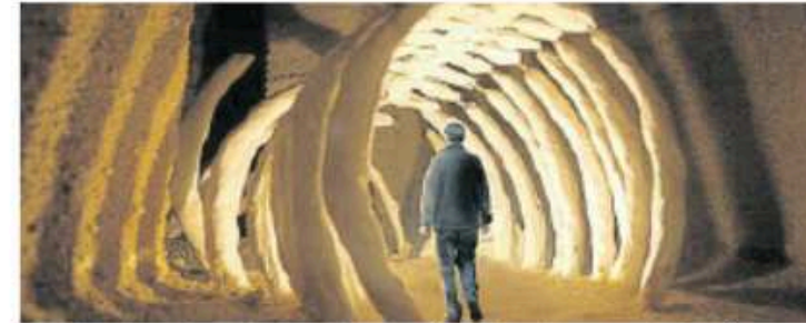
Une simulation d'une des installations prévues dans les caves des Perrières.