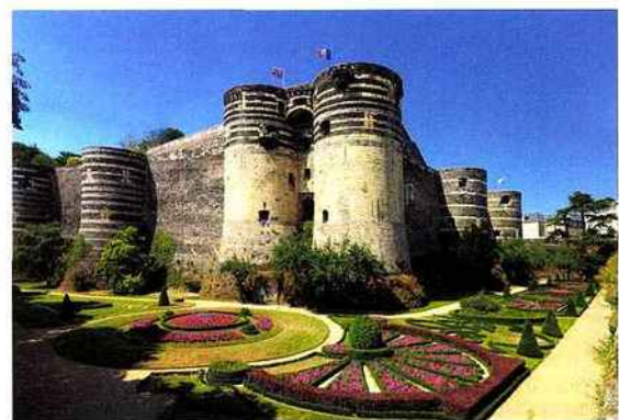
Le château d'Angers est l'une des plus importantes forteresses médiévales au monde. Il fut édifié sous le règne de Saint-Louis.

piétonnières vers la collégiale Saint-Martin, en partie carolingienne, la grande place haussmannienne du Ralliement et la cathédrale gothique, qui offre la plus grande nef unique de France. Avec sa cinquantaine de maisons à pans de bois, ses restaurants et petits bars, Angers offre un cadre de vie urbain préservé, mêlant bouillonnement étudiant et quiétude recherchée par les seniors. C'est aussi la patrie du