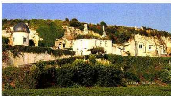
Depuis des siècles, les falaises de tuffeau qui encadrent la Loire ont été creusées pour abriter un étonnant habitat troglodyte.

d'Epiré héberge quelques camping-cars pour la nuit, où son propriétaire se fera un plaisir de vous faire profiter du superbe panorama qui surplombe la Loire.